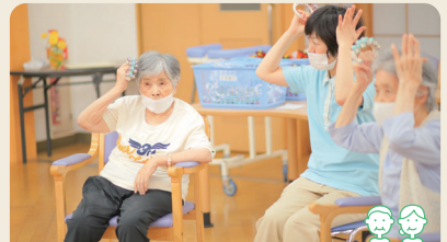
重度認知症老人デイケア

主に軽度の認知症の方が対象のデイケアです。家を出る機会が減った方や体力が落ちた方など、楽しく認知機能維持・介護予防をしてみませんか？