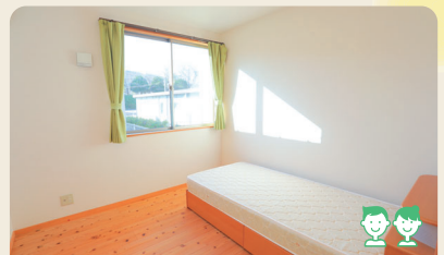
グループホーム「あいい」 訪問看護ステーションとも連携

ご自宅を訪問し、体温測定等一般的な健康チェック、お薬の確認、不安や悩み等の相談の他、家事やできない事を一緒にするなど、自分らしく生活する為のお手伝いをします。