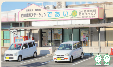
訪問看護ステーション「あいい」

生産活動などの機会の提供、知識及び能力の向上のために必要な訓練などを行います。利用者は作業分のお金を工賃としてもらうことができます。