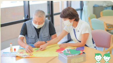
精神科デイケア/デイナイトケア

みんなでゲームをしたり、食事をしたり、対人関係の訓練や他者との交流の場になっています。所定の場所までの送迎もできます。