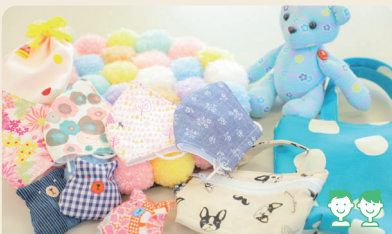
就労継続支援B型事業所「ワークステーションみたて」

みんなで体操やレクリエーションをしたり、グループで料理を作ったり、個別に入浴介助を受けたり、家庭的な雰囲気の中で1日をすごしていただけます。