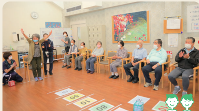
ユニットデイケア「のぞみ」

みんなでゲームをしたり、食事をしたり、対人関係の訓練や他者との交流の場になっています。所定の場所までの送迎もできます。